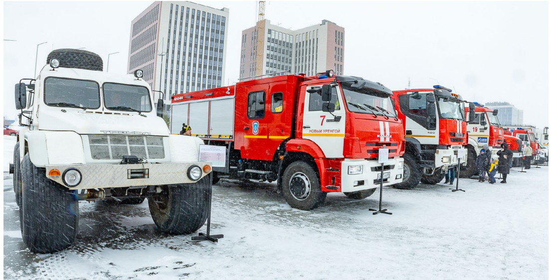
Выставка пожарной спецтехники

Желанными гостями в этот день стали ветераны пожарной охраны. Сотрудники части их тепло встретили, провели интересную экскурсию по депо. Ветераны смогли увидеть новейшее пожар-