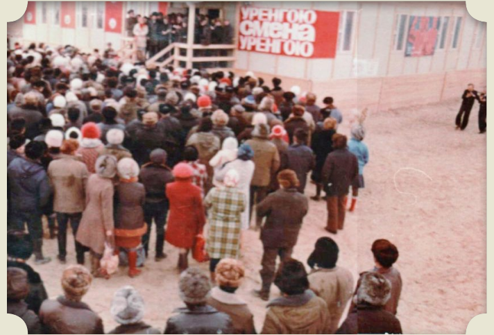
1979 год. Открытие взрослой библиотеки имени журнала «Смена»

Сегодня в составе централизованной библиотечной системы находятся шесть библиотек. Здание Центральной библиотеки расположено по адресу: улица Молодежная, 3А. Старое помещение было демонтировано, потому что мешало стройке виадука. Детская библиотека принимает посетителей в микрорайоне Оптимистов, 4/3.