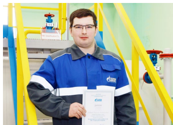
«СПОКОЙНО, УВЕРЕННО, БЕЗ ЛИШНЕЙ СУЕТЫ» Конкурс профмастерства стр. 5