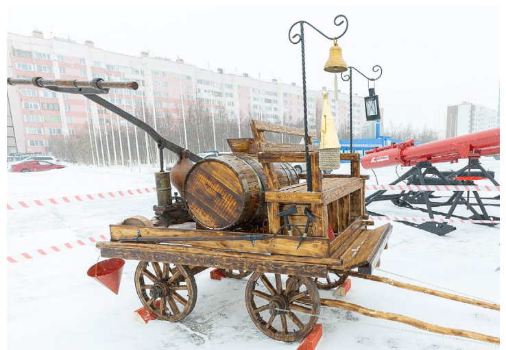
Пожарный обоз образца 1908 года