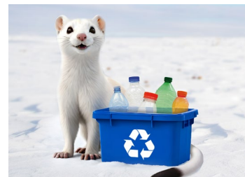
ЭКОСОВЕТЫ ОТ ГОРНОСТАЯ СЕНИ Охрана природы стр. 12