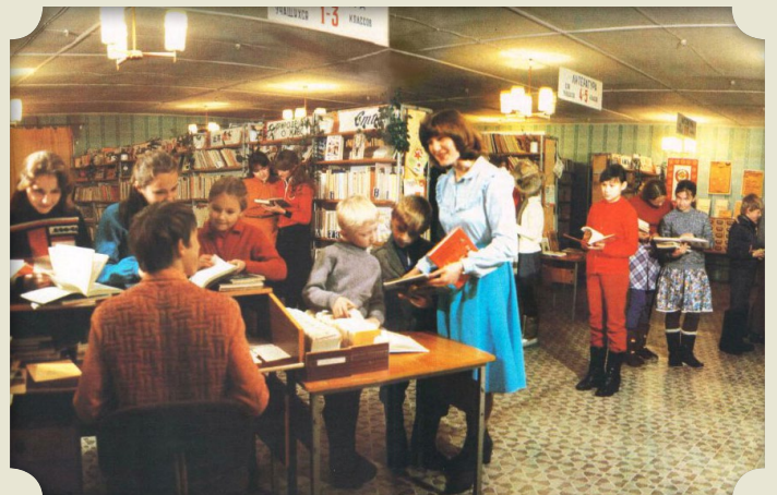
Дети в советской стране тоже были самыми читающими

12 мая, в честь 45-летия библиотеки имени журнала «Смена», с 10:00 до 17:00 пройдут праздничные мероприятия по адресу: улица Молодежная, 3А. В программе – мастер-классы, творческие встречи, квизы, литературный марафон и многое другое. Дополнительная информация по телефону 24-55-42.