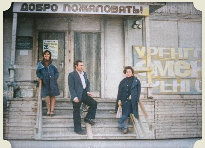
«Девушка, как пройти в библиотеку?»