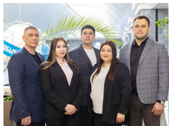
ОБЛАДАТЕЛИ ГЕНА ГАЗОДОБЫТЧИКА Семейное дело стр. 6-7