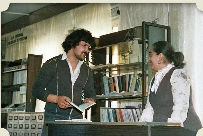
1983-1984 годы. Недостатка в читателях в это время не было

12 мая, в честь 45-летия библиотеки имени журнала «Смена», с 10:00 до 17:00 пройдут праздничные мероприятия по адресу: улица Молодежная, 3А. В программе – мастер-классы, творческие встречи, квизы, литературный марафон и многое другое. Дополнительная информация по телефону 24-55-42.