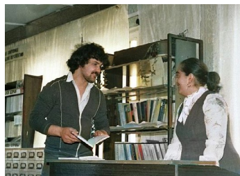
С ЮБИЛЕЕМ, «СМЕНА»! История в объективе стр. 11