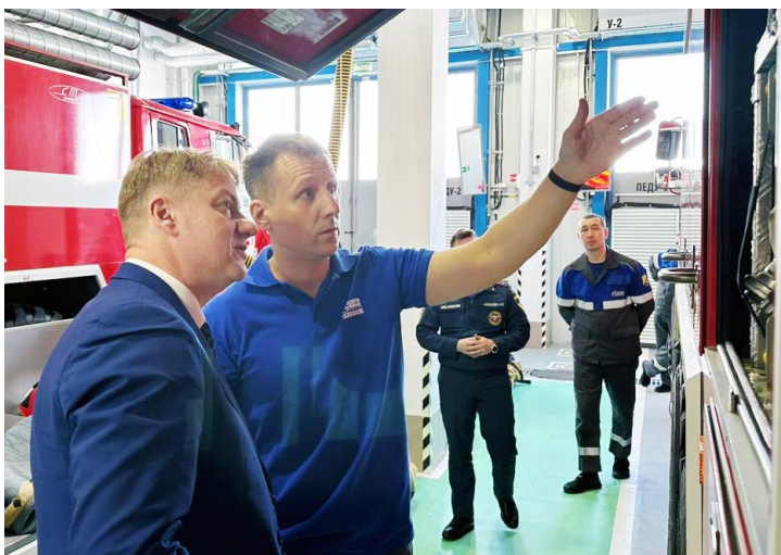
Ветераны на экскурсии в депо

Ежегодно в «Газпром добыча Уренгой» проводится свыше 420 противопожарных мероприятий.