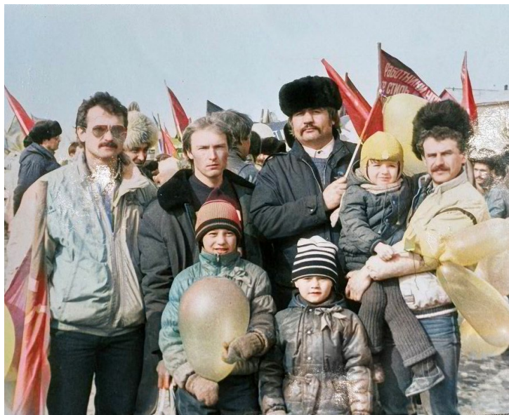
Три поколения династии на праздничных демонстрациях: в 1986 году и в 2013-м

– За 13 лет на рабочей должности я повысил свой разряд со второго до пятого, параллельно закончил Тюменский нефтегазовый институт, когда руководство предложило занять инженерную должность, согласился.